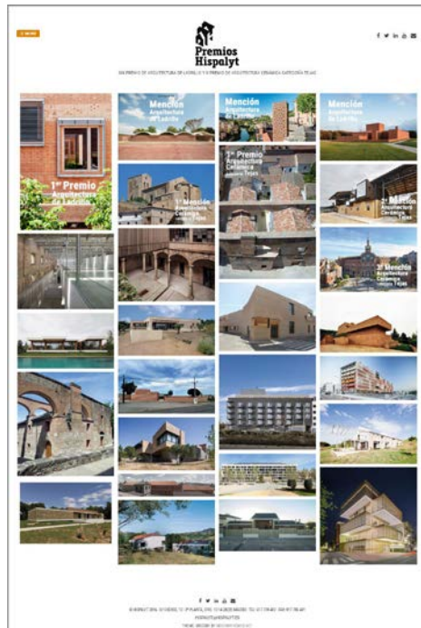
Imagen: página web Premios de Arquitectura HISPALYT 2013/2015

Además de este libro sobre los Premios, se ha publicado una página web con información detallada e imágenes sobre las obras premiadas y seleccionadas de los Premios de Arquitectura de Hispalyt: http://premios2015.conarquitectura.org/