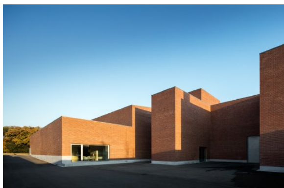
Foto: Mención XIII Premio de Arquitectura de Ladrillo Arquitectos: Álvaro Siza y estudio asociado ARESTA: Manel Somoza y Manel González

El acta con el Fallo del Jurado y las fotografías y planos de las obras ganadoras y mencionadas se encuentran disponibles en el apartado del XIII Premio de Arquitectura de Ladrillo de la página web de Hispalyt www.hispalyt.es .