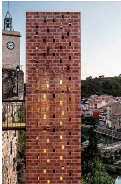
Foto: Mención XIII Premio de Arquitectura de Ladrillo Arquitecto: Carles Enrich

Mención: Teatro-Auditorio de Llinars del Vallés (Barcelona) , del arquitecto Álvaro Siza y el estudio asociado ARESTA: Manel Somoza y Manel González . Esta obra se valora por la cuidada ejecución de la fábrica de ladrillo, en un entorno de gran valor paisajístico, al que los volúmenes ciegos, (adecuados para los usos que se albergan), podría alterar. A través del control de la escala y el escalonamiento de las piezas y la sensibilidad en la elección de la textura del material de las fachadas ciegas se consigue, a juicio del jurado, una integración adecuada.