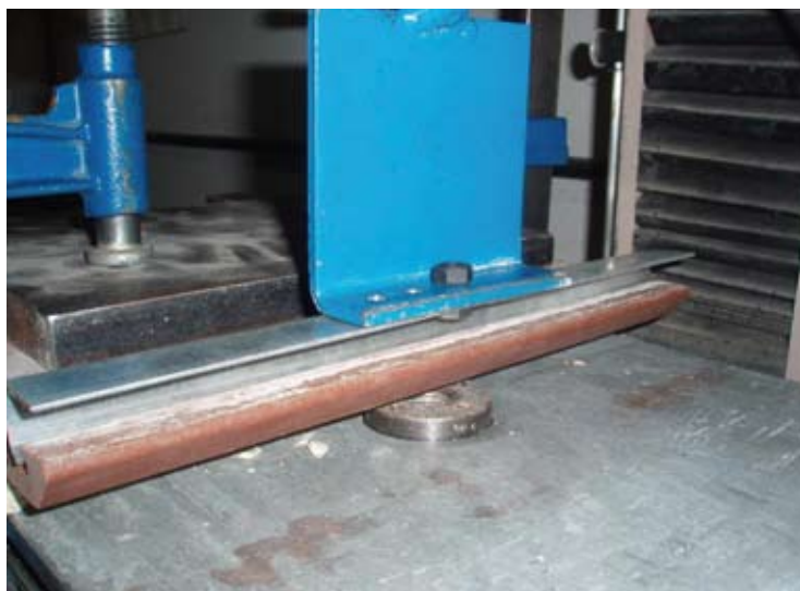
Ensayo de resistencia de la ranura del revestimiento.