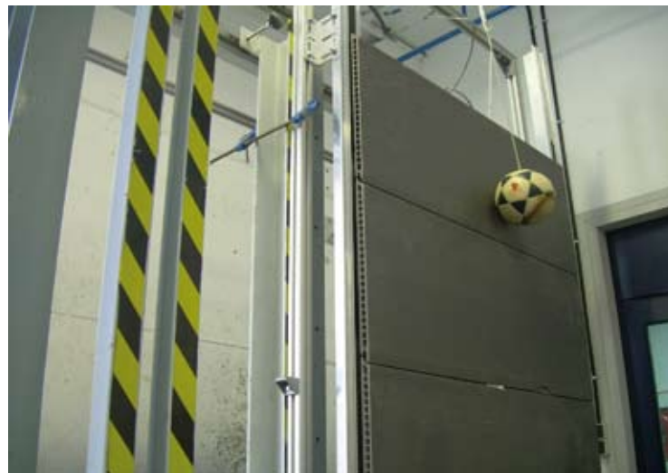
Ensayo de impacto de cuerpo blando (3 kg).

Para esta evaluación deben tenerse en cuenta las características del edificio, y las de sus usuarios (por el interior y por el exterior), lo cual condicionará la severidad de las posibles acciones.