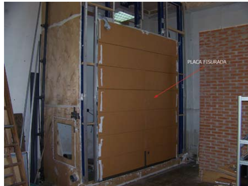
Imagen 1: Ensayo de resistencia al viento

Sobre la hoja exterior se recomienda realizar comprobaciones mediante cálculo de: