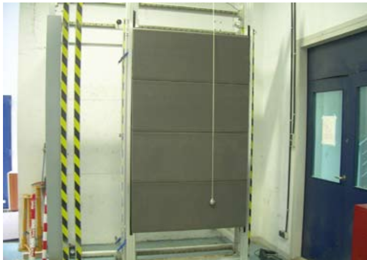
Ensayo de impacto de cuerpo duro (1 kg).

Sin embargo, y puesto que la fachada debe ser funcional en las condiciones de uso previstas, cabe evaluar su comportamiento frente a los posibles impactos procedentes del exterior del edificio y procedentes del interior, para lo cual se emplean los métodos de evaluación propuestos en el borrador de Guía de DITE 034 ( Kits for external wall claddings ) y de la Guía de DITE 003 ( Internal partitions kits ).