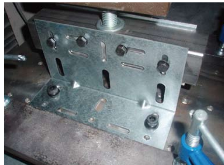
Ensayo de ménsulas a carga horizontal (succión).

El modelo de cálculo debe representar adecuadamente los puntos de apoyo tal y como se representan en el diseño del sistema, siendo recomendable independizar los movimientos de la hoja exterior de los movimientos de la estructura del edificio y de la hoja principal.