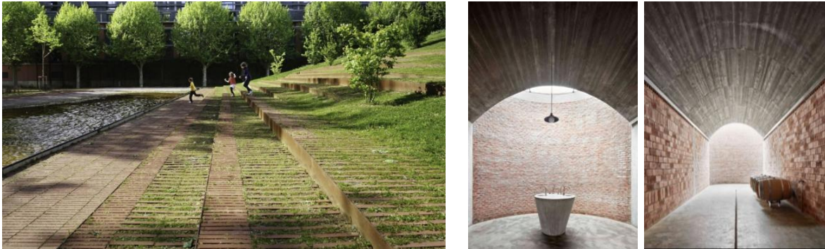
Pie de foto: De izquierda a derecha, Le Jardin Niel y Bodega Mont Ras.

Mención ex aequo Categoría “No residencial”: A la Bodega Mont Ras (Girona) de los arquitectos Jorge Vidal y Víctor Rahola y a Le Jardin Niel (Toulouse, Francia) de Michele & Miquel Architectes. En la Bodega Mont Ras, el Jurado ha tenido en consideración la conveniencia de las estructuras murarias para esta edificación semienterrada, con numerosos detalles en los que la cerámica es protagonista por sus cualidades de textura, reflexión de la luz y calidez ambiental. En el Jardin Niel al Jurado le ha parecido especialmente interesante utilización espacial del ladrillo cara vista para la urbanización de un parque, por la buena resolución de los detalles constructivos y el ajuste preciso a una topografía definida con sensibilidad hacia el sitio.